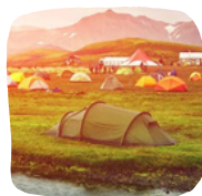
Διαμονή σε καταφύγιο