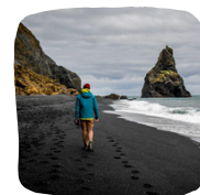
Black Sand Beach