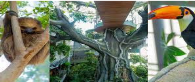
THE GREEN PLANET

Εξερευνήστε έναν ολόκληρο νέο κόσμο εξωτικής χλωρίδας και πανίδας σε αυτό το καθηλωτικό τροπικό δάσος που κατασκευάστηκε στο Ντουμπάι το Green Planet. Σας προσκαλούμε λοιπόν, να ανακαλύψετε το σημαντικό ρόλο που τροπικά δάση παίζουν στο μέλλον του πλανήτη μας με πάνω από 3.000 φυτά και ζώα!