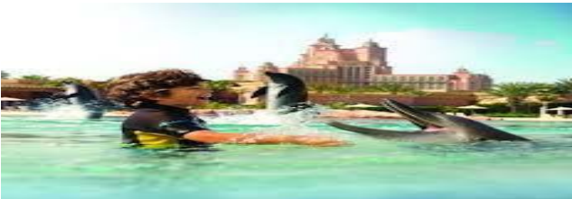
ΚΟΛΥΜΠΙ ΜΕ ΔΕΛΦΙΝΙΑ

Μπειτε στην πισίνα και νιώστε την μοναδική εμπειρία να βρίσκεστε στον ίδιο χώρο, να κολυπήσετε και να βγείτε φωτογραφίες με τα πανέμορφα θαλάσσια θηλαστικά τα δελφίνια!