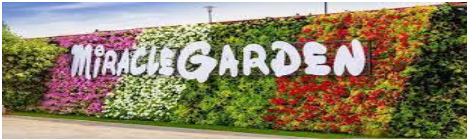
DUBAI MIRACLE GARDENS

Επισκεφτείτε το μοναδικό και υπέροχο πραγματικά DUBAI MIRACLE GARDENS . Εδώ θα δείτε πάνω από 45 εκατομμύρια ανθισμένα λουλούδια σε μοναδικές κατασκευές , σχήματα και χρώματα με 45 διαφορετικές ποικιλίες Όλα αυτά και άλλα πολλά μπορείτε να απολαύσετε κάτω από τους 5 τεράστιους θόλους με τα χιλιάδες κρεμαστά καλάθια λουλουδιών , πίνοντας ένα κοκτέιλ φρούτων, καφέ η τρώγοντας ένα σνακ να χαλαρώσετε και να χαθείτε μέσα σε αυτό το εκπληκτικό περιβάλλον