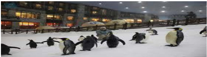
ΧΙΟΝΟΔΡΟΜΙΚΟ ΚΕΝΤΡΟ – EMIRATES MALL

Στο φημισμένο εμπορικό κέντρο Emirates Mall κατασκευάστηκε το πρώτο κλειστό χιονοδρομικό κέντρο στην Μέση Ανατολή. Επισκεφτείτε το και κάντε σκι μόνοι σας ή με δάσκαλο, διασκεδάστε με την Snow Bullet ή ακόμα δειτε από κοντά και ταΐσετε πιγκουίνους!